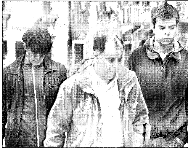
I ragazzi protagonisti della rissa con il padre poliziotto

I sindacati difendono le Volanti: «Ogni scusa è buona per attaccare le forze dell'ordine»