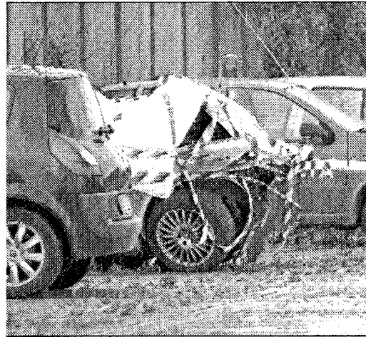
L'auto della polizia dopo il tragico schianto

Un collega: «Preferirei morire per un colpo di pistola, sai che è un rischio del mestiere, ma non così». Forse ci sarà una funzione in città prima delle esequie a Catania