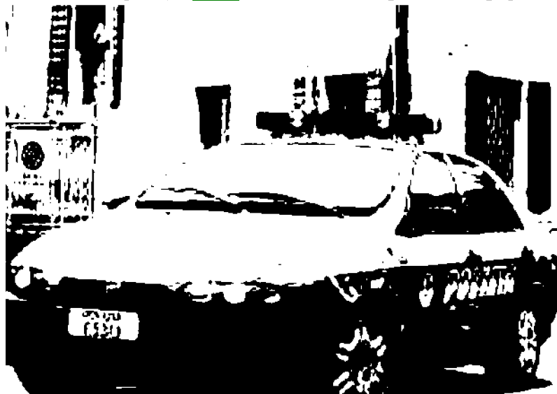
un'immagine della questura di Belluno e di una volante. Ancora incerto il trasferimento alla Fantuzzi

finisce «tutta bellunese». Ma soltanto un mese fa, dopo vari viaggi della speranza a Roma del sindacato, pare che la situazione si sia sbloccata e che le indennità arretrate siano prossime al pagamento.