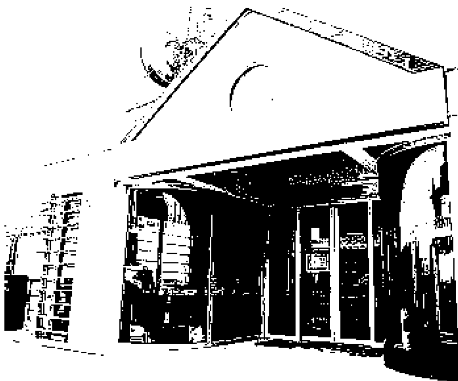
► L'ingresso della questura di Venezia

◉ Polemica a distanza tra i sindacati e un comitato di cittadini sulle responsabilità del fatto