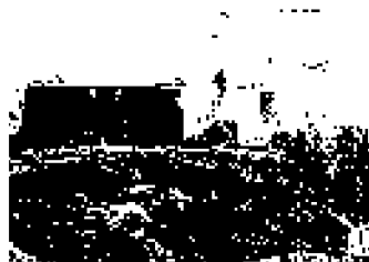
► La Maddalena in Sardegna